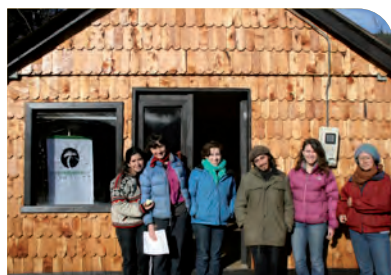
Nueva Oficina en Palena

Desde finales de Julio la Fundación Patagonia Sur cuenta con Oficina en Palena, muy importante para tener una relación más cercana con la comunidad y sus necesidades.